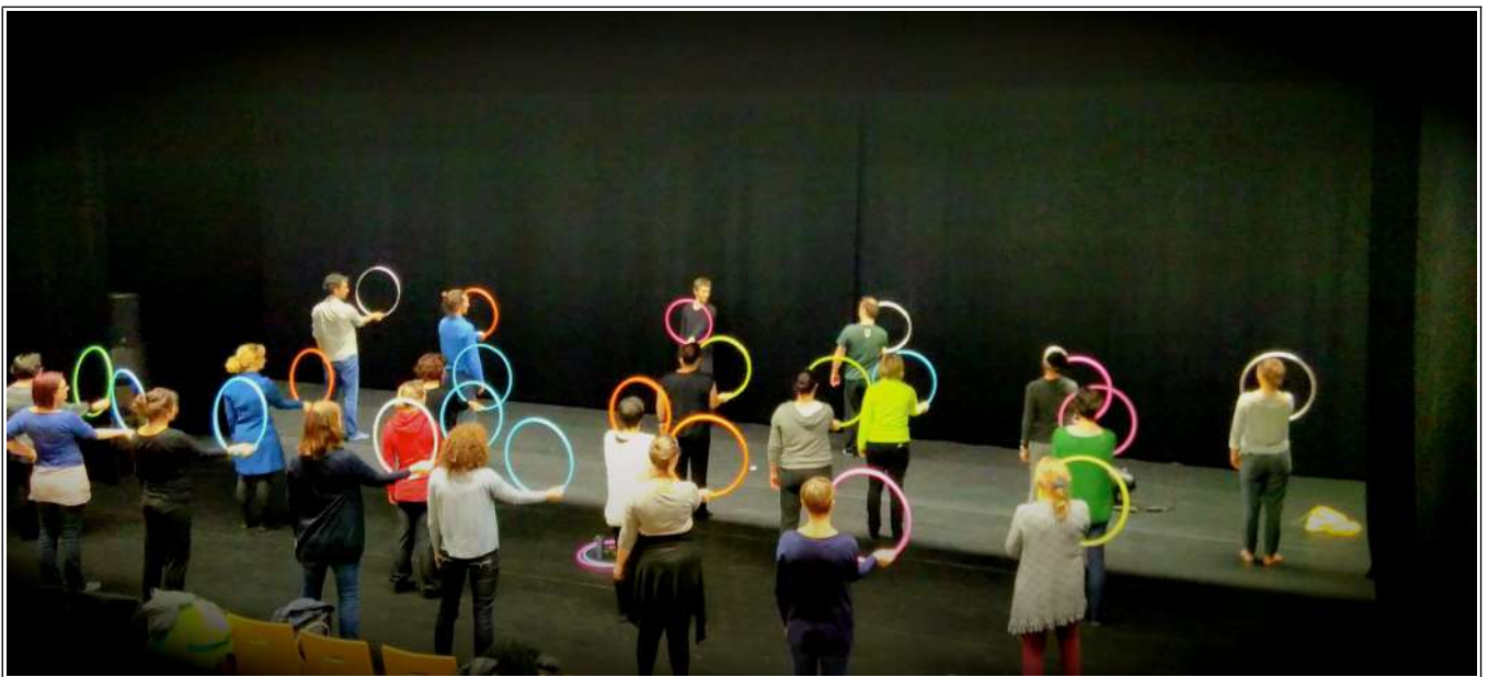
Découverte de la manipulation graphique – Festival Circonova / Théâtre de Cornouaille – Scène Nationale de Quimper.

Elle devrait être connue de tou.te.s les élèves d'école de cirque quelle que soit leur discipline ! Elle peut être expliquée à des personnes qui ont déjà touché les objets au moins quelques heures.